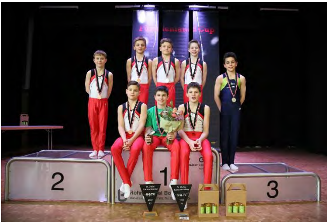
Gruppenbild P2, P3, P4